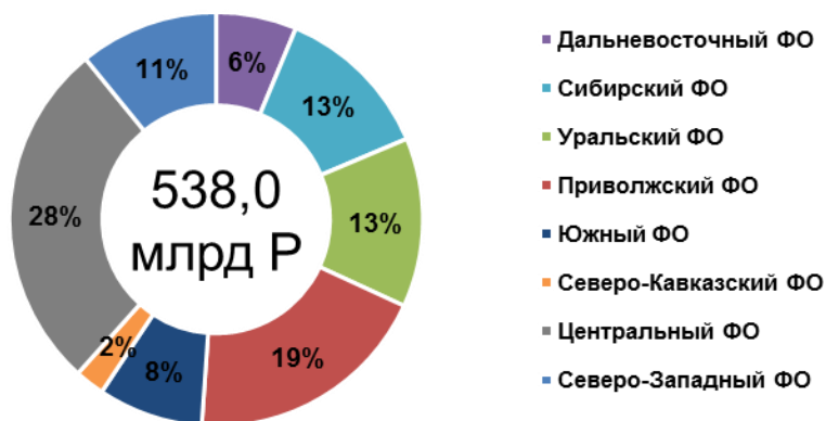
Структура задолженности на 31.05.2026г.