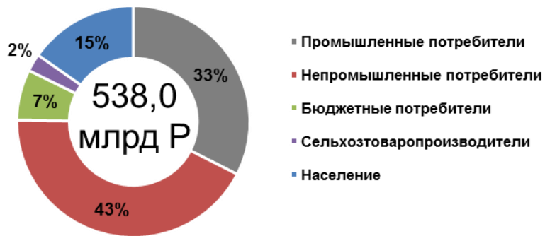
Структура задолженности на 31.05.2026г.